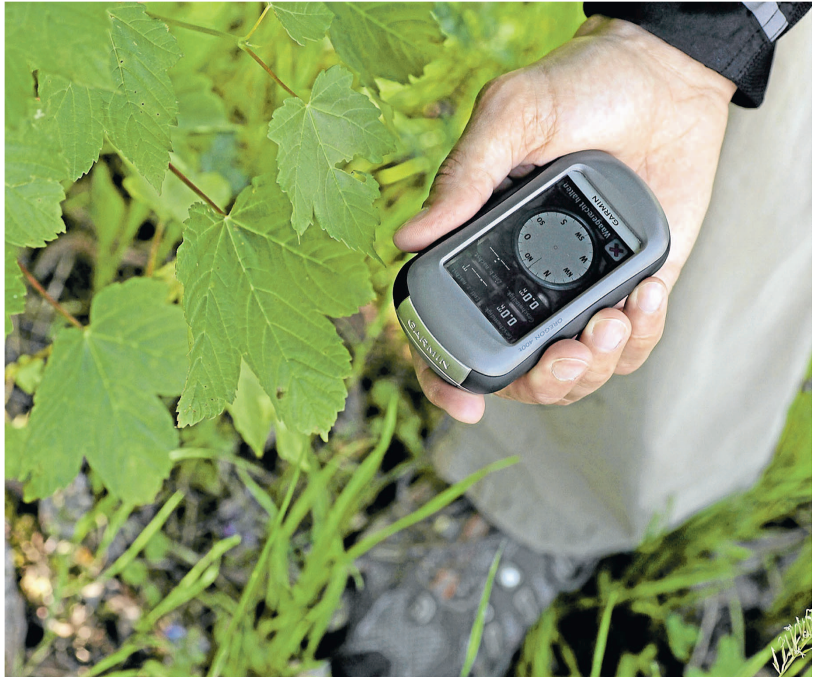
Geocaching entwickelt sich mehr und mehr zum Volkssport.

Damit wurde eine Kooperation ins Rollen gebracht, von der die Schatzsucher ebenso profitieren wie die Umweltschützer. Seit 2011 ist der Nationalpark Harz Partner der alljährlichen Cito-Walpurgis-Events. Das Kürzel Cito steht für Caches in, Trash out (Schätze rein, Müll raus) und bezeichnet Müllsammelaktionen, zu denen Geocacher auf der ganzen Welt immer wieder aufrufen.