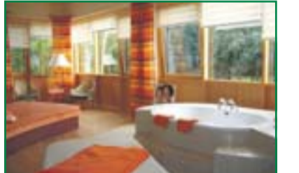
„Kröpke-Spa“ sorgt für Entspannung.

Heide-Kröpke Das Verwöhnhotel – ein Inbegriff exklusiver Gastlichkeit