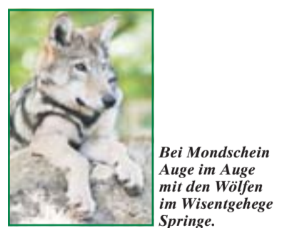
Bei Mondschein Auge im Auge mit den Wölfen im Wisentgehe Springe.

Der Kletterspaß, ein Abenteuer für alle Generationen.