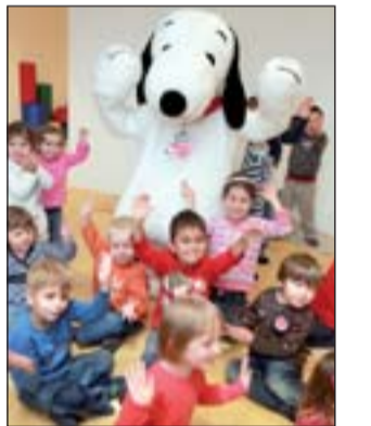
TIERISCH GUTE STIMMUNG: Die „Erdenkinder“ lassen Kult-Hund Snoopy hochleben.